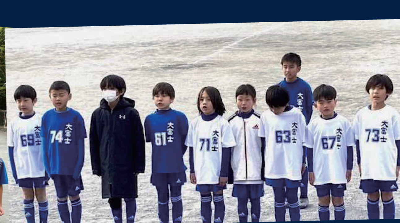
▲ 練習着・試合で着用する スポンサー入りユニフォーム(青・白)